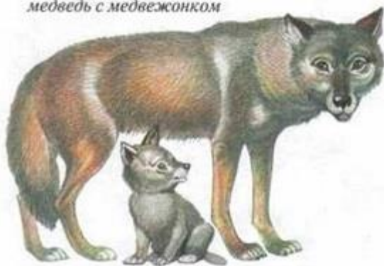
волк с волчонком