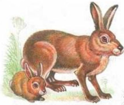
заяц с зайчонком

6. Назовите, повторите, выучите с ребенком названия детенышей диких животных.