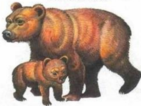
медведь с медвежонком