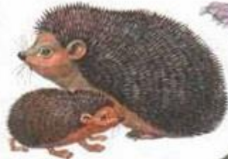
еж с ежонком