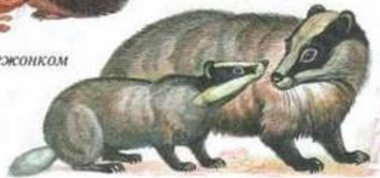
барсук с барсучонком