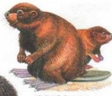
бобр с бобренком