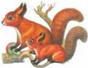
белка с бельчонком