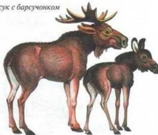
лось с лосенком