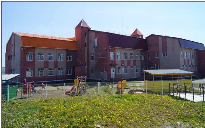
МАДОУ детский сад 18