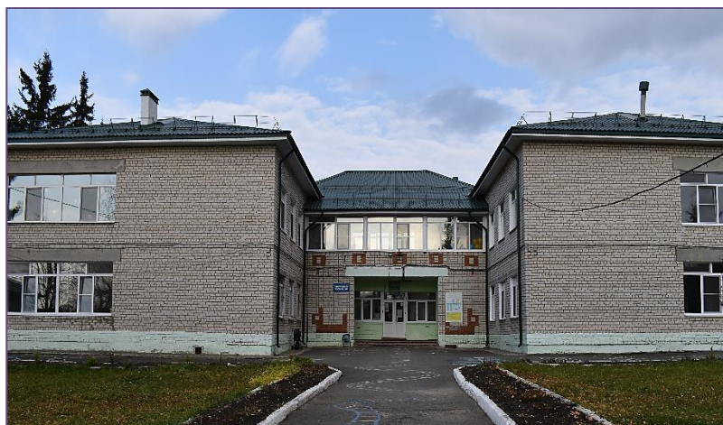
МАДОУ детский сад 6