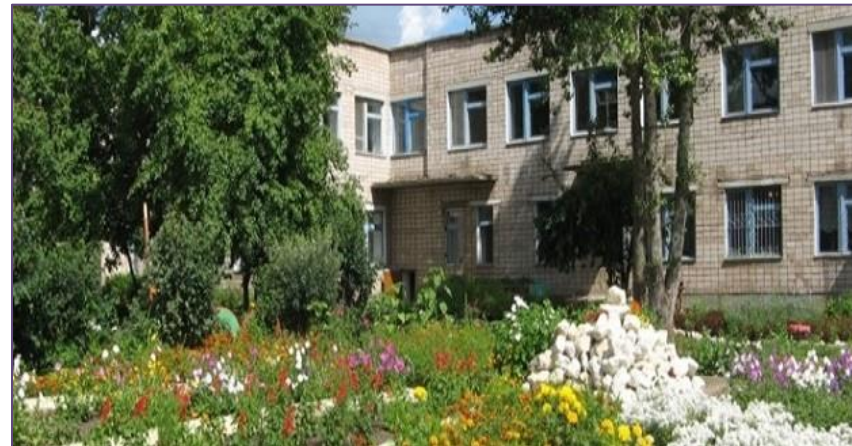
МАДОУ ЦРР-детский сад