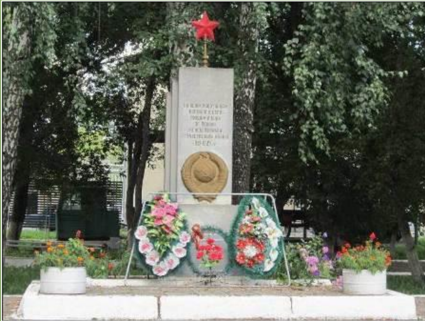
Памятник работникам вагонного депо, погибшим в годы Великой Отечественной войны