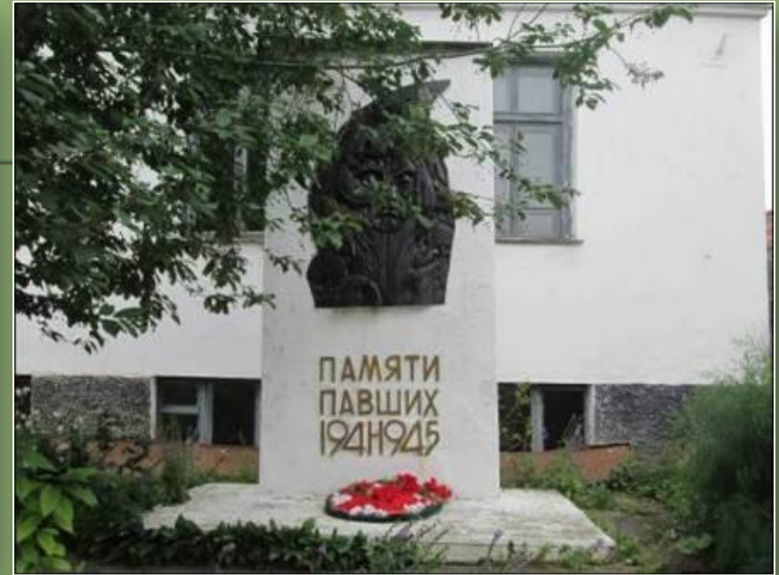
Памятник выпускникам педагогического колледжа, погибшим в годы Великой Отечественной войны