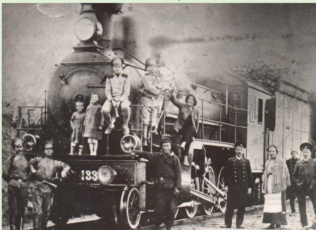
Первый поезд, прибывший в Красноуфимск

- В 1916 году в Красноуфимске пущено паровозное депо. В 1917 году — строительство мостов и земляного полотна были, в основном, закончены. - «Детство» линии «Казань-Екатеринбург» было очень трудным, но, несмотря на это, 14 марта 1919 года на станцию Красноуфимск их Екатеринбурга прибыл первый поезд. Это событие и стало началом действия нашей станции.