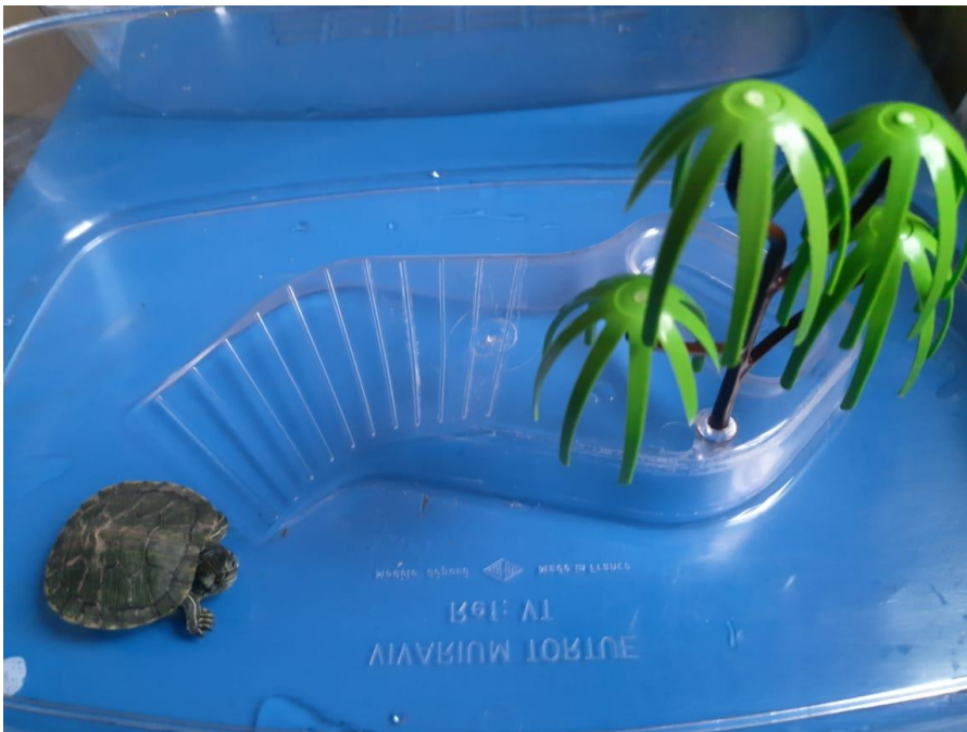
Глеб со своей черепашкой Зубастиком