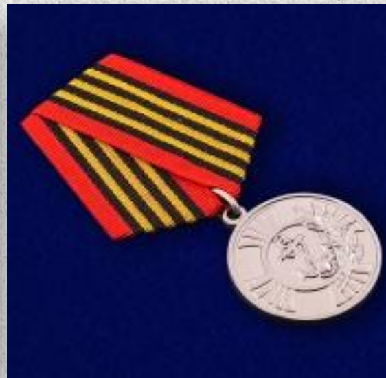
Медаль Морской пехоты «За заслуги»