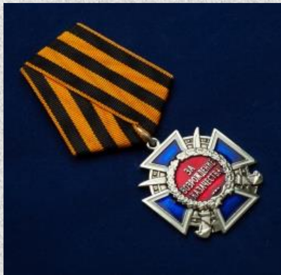
Медаль «За возрождение казачества»